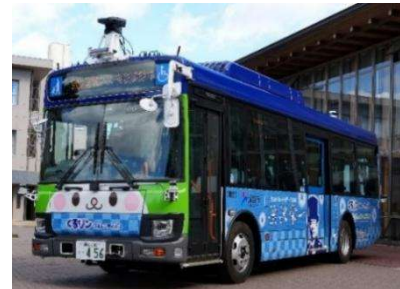
▲『くるリン』定時定路線『北部シャトル便+周遊便』で使用する車両

また、同時に『くるリン』定時定路線の運行を再編し、『地域の足』としての利便性向上を図るとともに、新1万円札の肖像である渋沢栄一翁のふるさとを訪れる観光客の増加に伴う観光ニーズに対応するため、『北部シャトル便+周遊便』を創設します。