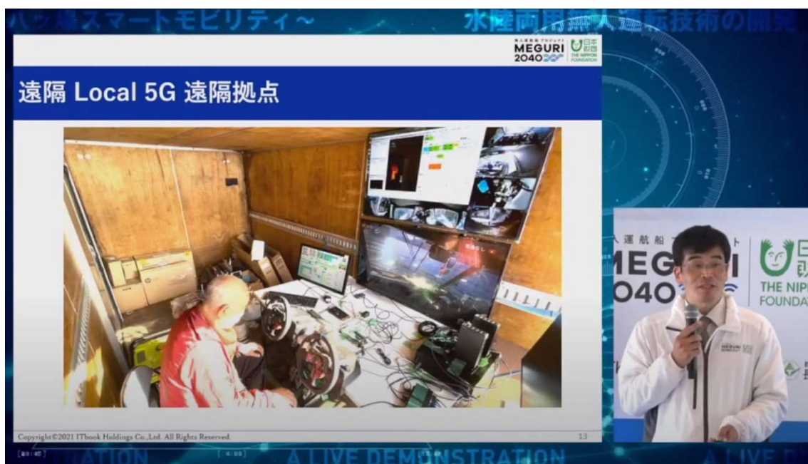
ローカル 5G や LTE を用いた遠隔操作の実証実験

なお、今回の公開実証実験では時間の都合により、報道関係者には実施の報告のみとなりましたが、ローカル 5G や LTE を用いた遠隔操作についても評価しています。ローカル 5G で送られてくる鮮明な映像を基に遠隔操作をするという実験でしたが、LTE の通信で少しの課題はあったものの、こちらも無事成功しています。