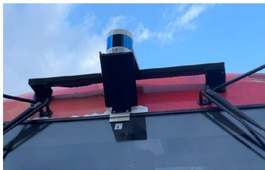
周囲状況を把握するセンサー（LiDAR）を設置