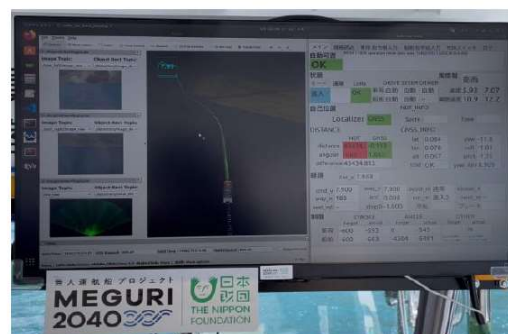
開発中の経路追従・避航システムの画面