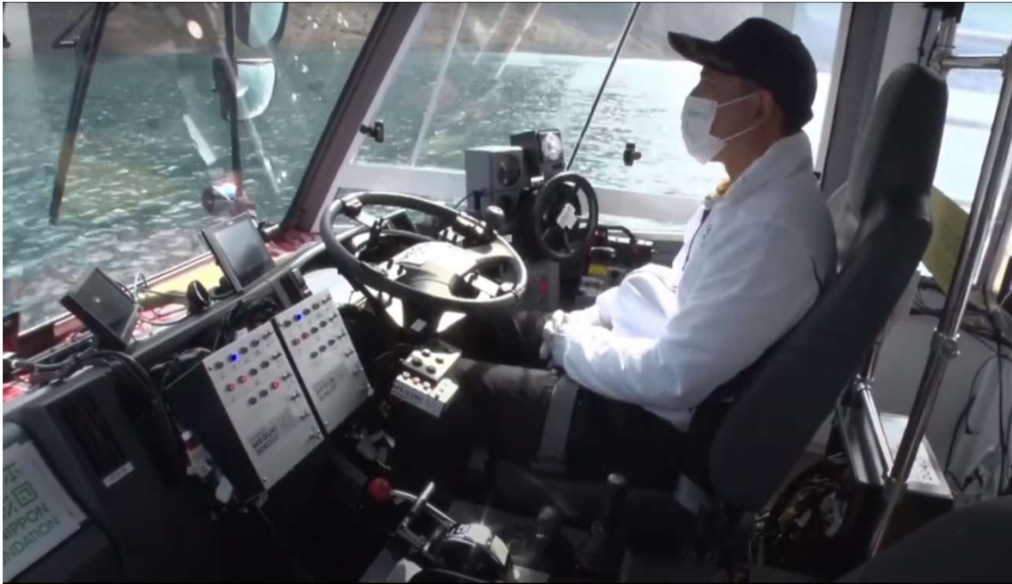
自動航行中の運転席の様子

のエンジン始動やブレーキ、水上でのかじ取りなどは全て自動で行われました。航行中、運転手も着席していますが、ハンドルにもアクセルにも触れていません。